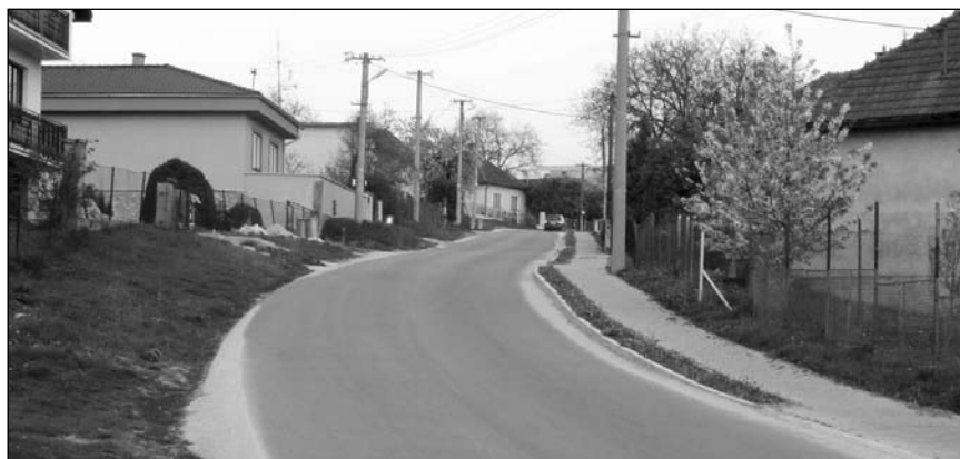
Nový asfaltový koberec na štátnej ceste