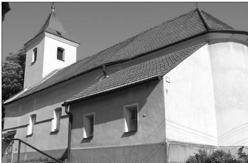
Kostol Panny Márie

Obec leží na severovýchode Nitrianskej sprašovej pahorkatiny, na hornom toku ľavostranného prítoku Bebravy. Odlesnený chrbát chotára tvoria trefohorné usadeniny, pokryté sprašovými hlinami. Archeologický výskum potvrdil nálezy z doby lužickej kultúry v mladšej dobe bronzovej. Pravotice so svojím okolím patrili už do doby staroslovanského osídlenia Slovenska. Dokazuje to