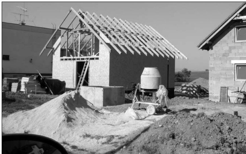
Rozostavané rodinné domy

Obec prešla viacerými zmenami rozvoja budovania infraštruktúry a zlepšovania životných podmienok občanov. V súčasnosti sa s rozvojom životnej úrovne a modernizáciou snaží vytvárať podmienky pre stále lepšiu a kvalitnejšiu život občanov. Svedčí o tom rekonštrukcia verejného osvetlenia a miestneho rozhlasu, budovanie chodníka, opravy a modernizácia verej-