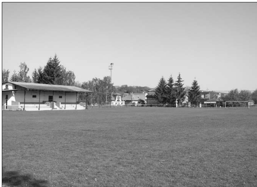
Ihrisko a kabíny TJ Sokol Pravotice