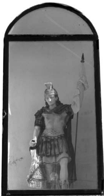
Svätý Florián – patrón hasičov