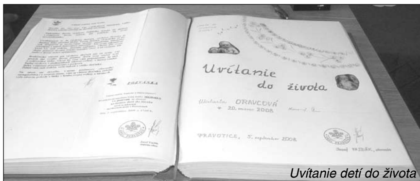
Uvítanie detí do života

Zachovávajú sa ľudové tradície – stavanie mája, pripomíname si Deň matiek, Medzinárodný deň detí, Mikuláš chodí so svojím sprievodom – anjelom a čertom po obci a rozdáva deťom balíčky. Obnovili sme uvítanie narodených detí do života.