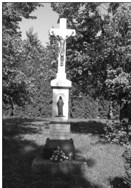
Križ pri kostole

aj staroslovanský birituálny mohylník zo 7. – 8. storočia vo Vysočanoch, mohylník v Brezolupoch, veľkomoravské hradisko v Skačanoch, veľkomoravské pohrebisko zo 8. storočia v Žabokrekoch s dodnes jestvujúcou gotickou tvrdzou strážnej veže, mohylník v Šišove a v Hradišti.